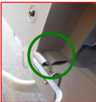
Figur 1D – Godkänd spärr