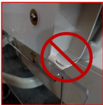
Figur 1C – Trasig spärr