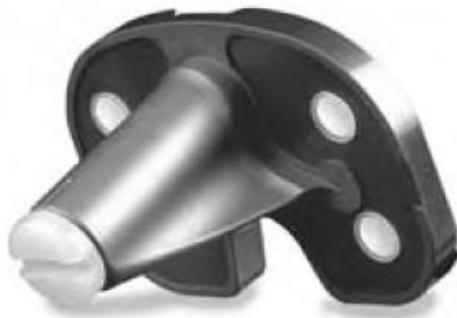
NexGen Precoat Tibial Plate