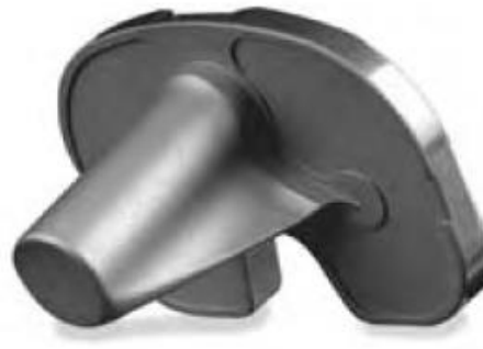
NexGen Option Tibial Plate